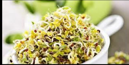
Un plat chinois