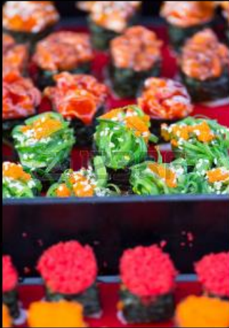
Un plat japonais