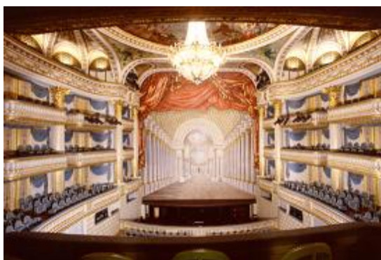
La scène et la salle de spectacle