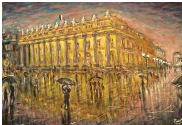
Tableau de Jacques Ruiz